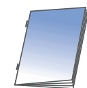
Agrafage à plat + pliage