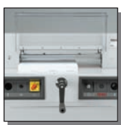
Carter de protection avant